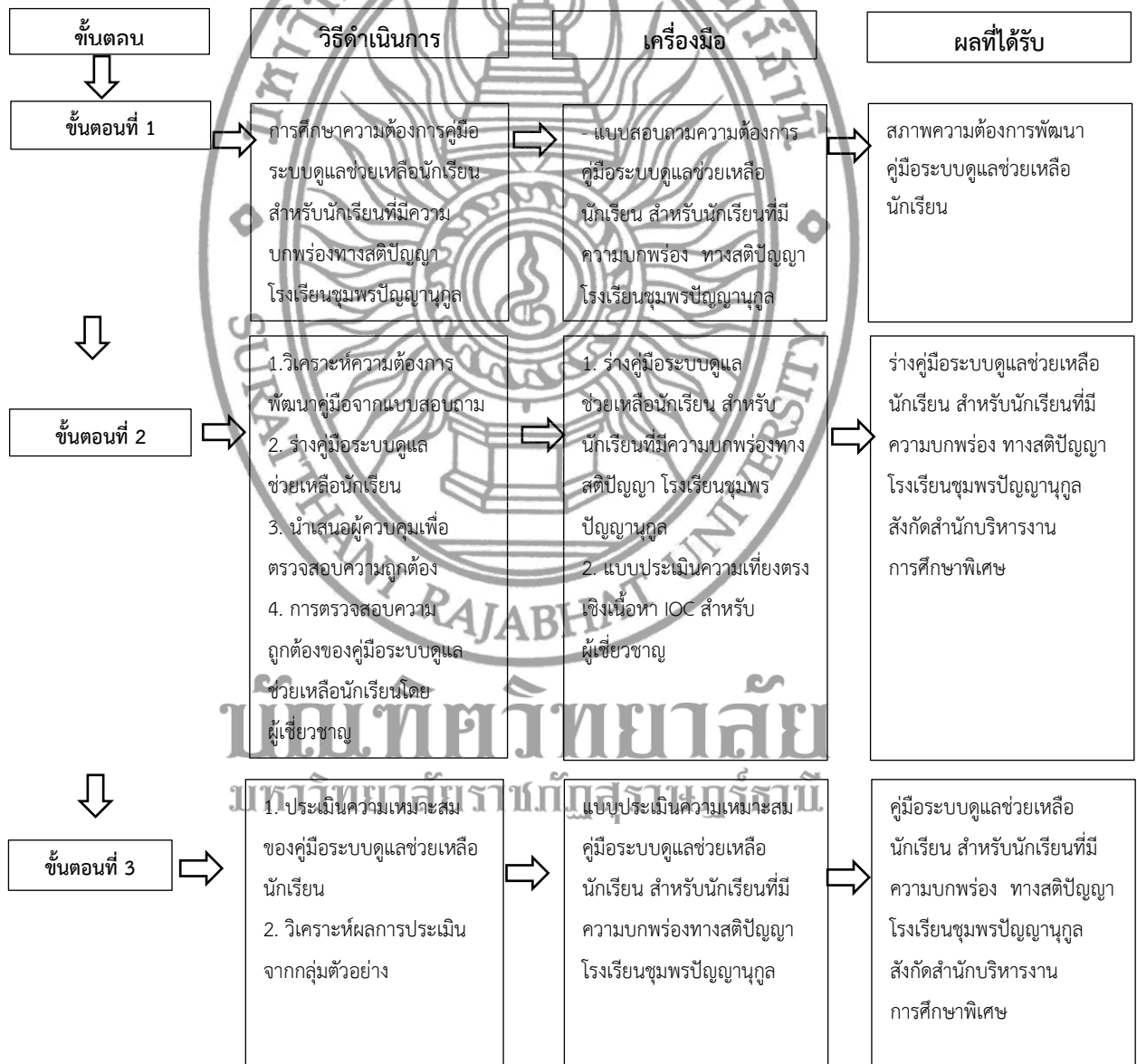
ภาพแสดง ที่ 3.1 ขั้นตอนการดำเนินงานวิจัย (ต่อ)

ขั้นตอนที่ 3 ประเมินความเหมาะสมของคู่มือระบบดูแลช่วยเหลือนักเรียน สำหรับนักเรียนที่มีความบกพร่องทางสติปัญญา โรงเรียนชุมพรปัญญาคุณ สังกัดสำนักบริหารงานการศึกษาพิเศษ