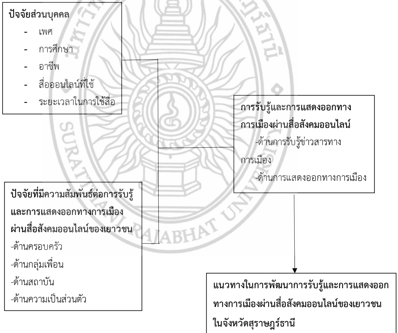
ภาพที่ 1.1 กรอบแนวคิดในการวิจัย

กรอบแนวคิดที่ใช้ในการศึกษา “การรับรู้และการแสดงออกทางการเมืองผ่านสื่อออนไลน์ของเยาวชนในจังหวัดสุราษฎร์ธานี กรณีศึกษาความเคลื่อนไหวทางการเมืองระหว่างปี พ.ศ. 2564-2566” ดังนี้